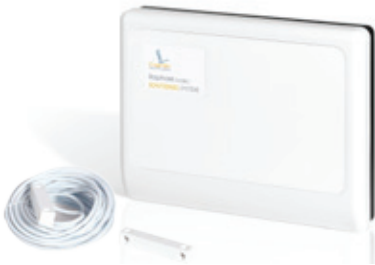
Basis-Einheit mit Netzteil und Magnet-Türkontakten

Jedes Raphael-home Schutzsystem verfügt über eine Grundausstattung, bestehend aus einer Basiseinheit, einem Armband mit Funkchip und patentiertem Verschluss und einem Funkempfänger.