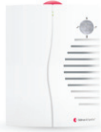
Bellmann BE1450 tragbarer Empfänger