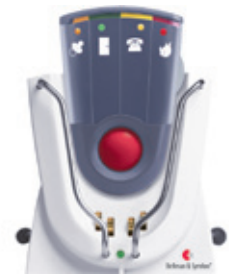
Bellman BE1260+1460 Taschenvibrator mit Ladestation