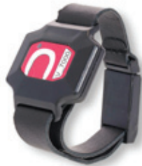
Transponder Armband mit Patentverschluss